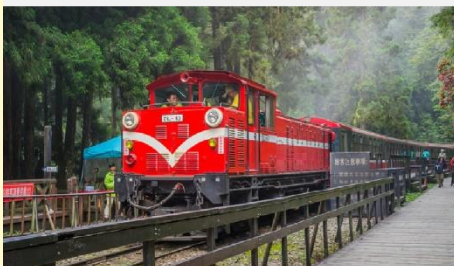
อุทยานแห่งชาติอาลีซาน