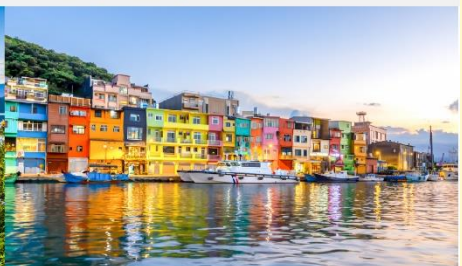
ทำเรือประมงเจิ้งปิ่น

*ทางบริษัทฯ ขอสงวนสิทธิ์ในการสลับโปรแกรมทัวร์ตามความเหมาะสมขึ้นอยู่กับสถานการณ์หน้างาน โดยคำนึงถึงผลประโยชน์ของลูกค้าเป็นสำคัญ